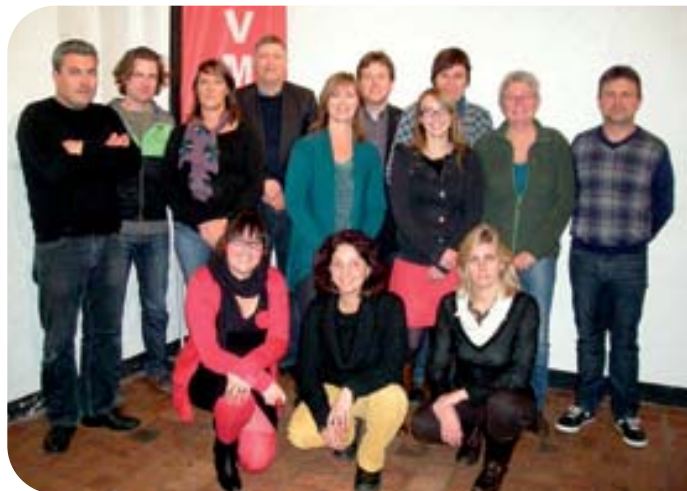
HET BESTUUR VAN HVV/OVM BRUGGE EN DE LEERKRACHTEN NCZ

Nieuw dit jaar was vooral de verhuis van het lentefeest voor de 6-jarigen van de Magdalenazaal naar de Stadschouwburg. Meer ruimte, meer plaats voor ouders en familie, meer mogelijkheden, een betere en veiligere accommodatie.