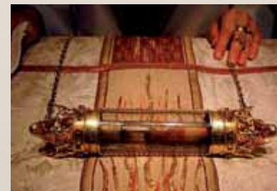
DE RELIKWIE VAN HET HEILIG BLOED