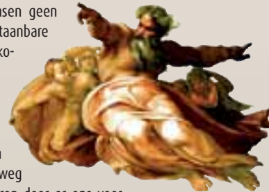
DETAIL VAN MICHELANGELO'S LAATSTE OORDEEL IN DE SIXTIJNSE KAPEL. GOD SCHEPT DE ZON

Heel de Westerse cultuur is weliswaar doordrenkt met de naam "god" maar het verlichtingsdenken blijft het beste antidotum tegen een opgedrongen "genade" tegen beter weten in. We hebben gods genade niet nodig om over ons eigen lot te beslissen en al helemaal niet om de "volmaakte hemelse heiligheid" te bereiken. Dat laatste willen we gewoonweg niet. We wensen geen slachtoffer te worden van de onweerstaanbare genade. Liever verworpen dan uitverkozen. Het atheïsme kan men niet "belijden" maar de aanhangers zijn zeker geen mensen die zich zedeloos of wetteloos gedragen. Zonder god wil niet zeggen zonder gebod. We hebben geen nood aan zo'n postmoderne uitweg die beweert dat we god kunnen ervaren door er ons voor open te stellen. We hebben als humanisten god niet nodig om onszelf en de andere te aanvaarden. Er is dan ook geen twijfel mogelijk: een wereld zonder god is ook een wereld-