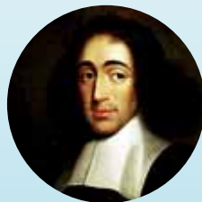
BENEDICT DE SPINOZA

In zijn besluit over de betekenis van Spinoza's opvattingen daarover schrijft Israel: "Door zich meer te richten op de vrijheid van het individu en de vrijheid van meningsuiting dan op gewetensvrijheid en vrijheid van eredienst, schied Spinoza in feite meer ruimte voor vrijheid en mensenrechten dan Locke en hoewel dit tot voor kort te weinig erkend werd, baande hij een meer directe en waarschijnlijk belangrijker weg naar het moderne westerse individualisme dan Locke" (p. 205). Het waren trouwens de tolerantie-opvattingen van Spinoza en Bayle en niet die van Locke die in het midden van de achttiende eeuw door de Franse radicale Verlichtingsfilosofen, namelijk door Diderot, d'Alembert en de andere Encyclopédistes, werden aanvaard en als uitgangspunten gekozen voor verdere uitwerking. Diderot scheidde de morele waarheid radicaal van de invloedssfeer van de kerk en wenste de kerken onder controle te brengen. Door deze en dergelijke ideeën toonde Diderot zich spinozistischer dan Spinoza en bayleaansers dan Bayle.