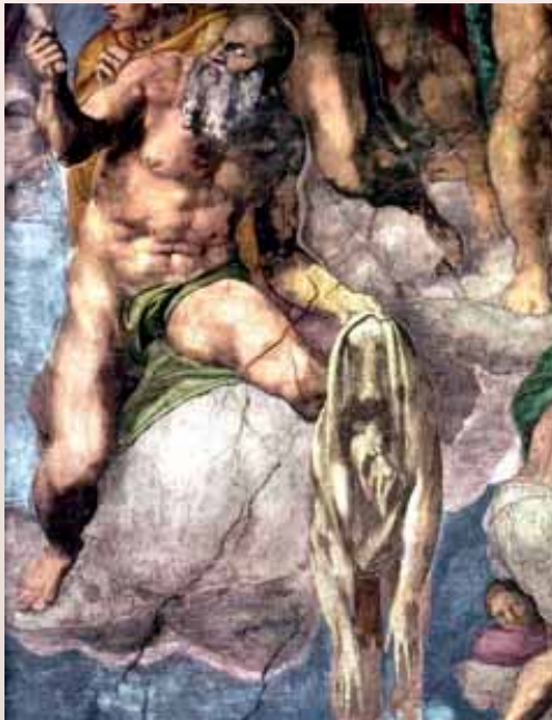
DETAIL VAN MICHELANGELO'S LAATSTE OORDEEL IN DE SIXTIJNSE KAPEL. SINT BARTHOLOMEUS HOUDT HET MES VAN ZIJN MARTELAARSCAP EN ZIJN GEVILDE HUID VAST.

den het loon van hun levenswandel te ontvangen. Naast de duivel en zijn gevallen engelen, worden de mensen die de genade van god hebben afgewezen verbannen naar de "buitenste duisternis", waar het "geween is en het tandengeknars", en zij zijn voor altijd afgesneden van gods tegenwoordigheid. Zij die de genade van god hebben aangemen door Jezus Christus als verlosser van zonden en bemiddelaar tussen god en de mensen, zullen gerechtvaardigd zijn in gods ogen en eeuwig leven beërven onder een nieuwe hemel, op een nieuwe aarde. En god zal in hun midden wonen. Dit gaat terug op typische apocalyptische geschriften die barst van de fantastische beeldspraak. Moderne christelijke theologen beschouwen deze teksten als niet meer toepasselijk voor onze tijd. Het leverde wel mooie kunstwerken op zoals Het Laatste Oordeel van Michelangelo in de Sixtijnse Kapel in Rome. Deze fresco's werden uitgevoerd tussen 1508 en 1512.