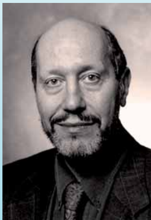
JONATHAN I. ISRAEL

Daar de gematigde Verlichting steeds weer poogde traditio-