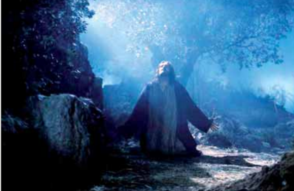
JEZUS IN DE HOF VAN GETHSEMANE

gelegen en er is een stank van ontbinding van het lijk. Gezien dit verhaal enkel voorkomt bij Johannes en niet bij de andere evangelisten wordt het door moderne theologen verwezen naar het land der fabelen. De neiging tot nauwkeurigheid gaat vrijwel steeds gepaard met de neiging tot verheving. In het Nieuwe Testament is dat fantasieproces de regel. Het oudste evangelie, dat van Marcus, wist de namen niet meer, maar de jongere evangeliën kennen ze precies. Ook hiernaar werd onderzoek verricht door Rudolf Bultmann. Een kleine illustratie. Marcus deelt mee dat in de hof van Gethsemane bij een slaaf een oor was afgeslagen maar Lucas weet meer: het was het rechteroor. Maar Johannes, de vierde en laatste evangelist weet inmiddels ook de naam van de discipel die het oor heeft afgehouden: het was Petrus. Maar hij weet ook hoe de slaaf heette: Malchus (Joh.18:10).